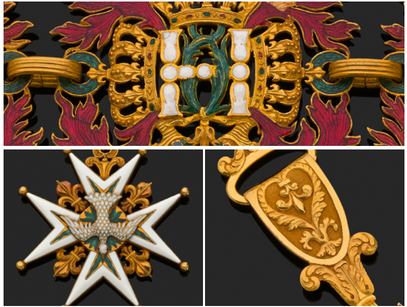
Collier réalisé par l'orfèvre Étienne-Hippolyte Coudray sous le règne de Louis XVIII