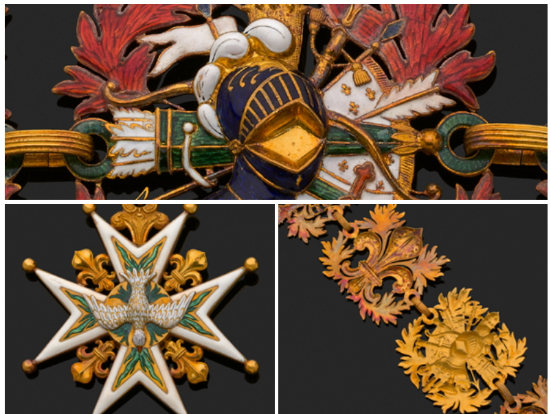
Colliers réalisés par l'orfèvre Jean-Charles Cahier à l'occasion du sacre de Charles X