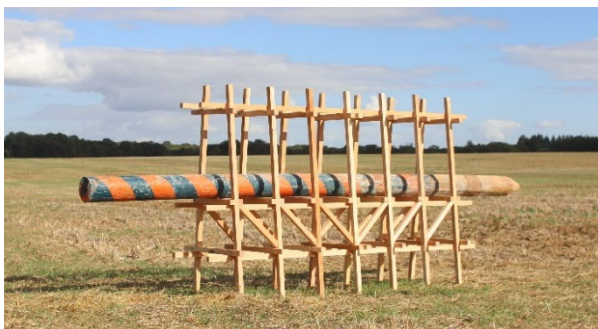
Renaud Auguste Dormeuil, © Renaud Auguste Dormeuil Se mi vedi, piangi / Si tu me vois, pleure , 2022. © Renaud Auguste Dormeuil

Né en 1968 et vivant à Paris, Renaud Auguste-Dormeuil questionne, depuis le milieu des années 1990, la fabrique des images, envisagées dans leur cadre public et politique.