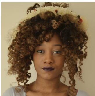
Marie-Claire Messouma MANLANBIEN, © Marie-Claire Messouma MANLANBIEN Ofi Titi , © Marie-Claire Messouma MANLANBIEN