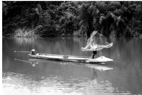
Louis-Cyprien Rials, Fishing Party, 2021. © courtesy Louis-Cyprien Rials, galerie Eric Mouchet et Hestia Art Residency & Exhibitions Bureau

« Prendre un objet à première vue simple et découvrir l'aspect le moins sombre et le moins documenté de celui-ci » : tel est le propos de Drop Tank de Louis-Cyprien Rials, une histoire des réservoirs largables au Laos.