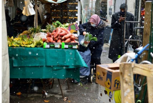
Ombre, de la série Princes de la rue , 2021. © courtesy Clarisse Hahn et galerie Jousse Entreprise.

La série Princes de la rue de Clarisse Hahn mélange des images d'archives – documentant les « rapports d'amour mêlés de haine qu'entretiennent l'Algérie et la France » depuis plus d'un siècle – et des portraits réalisés par l'artiste de vendeurs de cigarettes sous le point aérien de la station Barbès-Rochechouart.