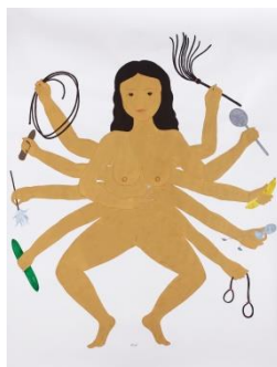
Kubra Khademi, The Creators , 2021 © courtesy Kubra Khademi et galerie Eric Mouchet.