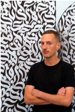
©Ali Y. Al-Baroodi devant l'affiche de « Au bord de la route de Wakaliga »