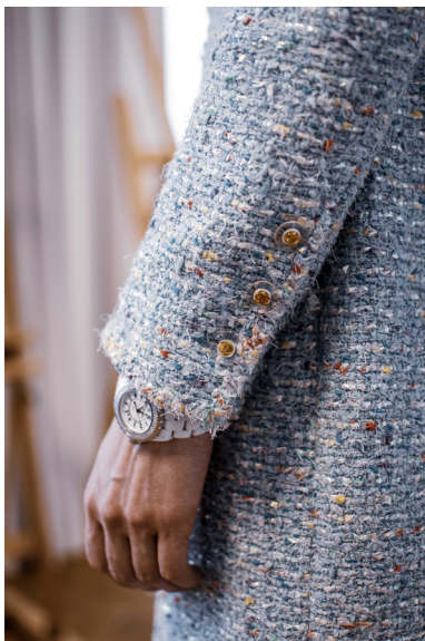
Lots 53 et 235