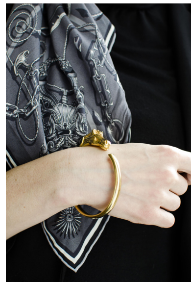
Lots 131 et 214