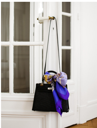
Lots 155 et 162