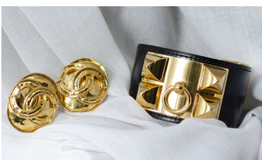
Lots 129 et 193