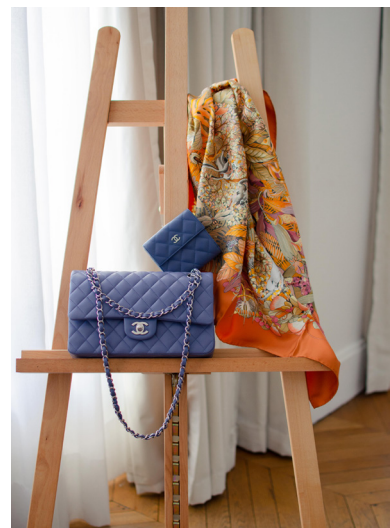
Lots 167, 168 et 201

53. CHANEL par Karl Lagerfeld - Collection Prêt-à-porter Printemps/Été 1997. Manteau en tweed multicolore à dominante bleue, décolleté en V, simple boutonnage siglé. 350/400€